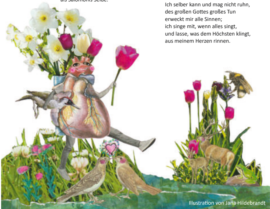
Illustration von Jana Hildebrandt

Ich selber kann und mag nicht ruhn, des großen Gottes großes Tun erweckt mir alle Sinnen; ich singe mit, wenn alles singt, und lasse, was dem Höchsten klingt, aus meinem Herzen rinnen.