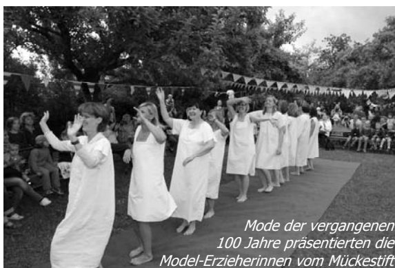
Mode der vergangenen 100 Jahre präsentierten die Model-Erzieherinnen vom Mückestift

Krönender Abschluss der Festwoche war das traditionelle Jahresfest auf Cyriak, das ganz im Zeichen der vergangenen 100 Jahre stand. „Wir sind Mückekinder, ja wir sind einmalig, einfach genialig...“ - ein Lied, das so manchem noch im Kopf rumschwirren dürfte, wurde extra fürs Jubiläum gedichtet und neben anderen tollen Ohrwürmern begeistert von den Mückekindern vorgetragen. Wie immer präsentierten einige Eltern ein sehr amüsanteres Märchenspiel – passend zum Anlass, gab es diesmal „Dornrösschen“ zu erleben. Höhepunkt jedoch war - darüber mussten sich alle Gäste einig sein - eine Modenschau, für die alle Erzieherinnen Model spielten. Gezeigt wurde die Mode der letzten 100 Jahre, angefangen bei Kleidern mit Wespentaille, über geringelte Badeanzüge aus den 20/30-er Jahren bis hin zu Schlaghosen