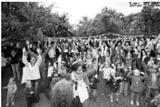
"Wir sind Mücke-Kinder!"

„Kinder, wie die Zeit vergeht“ lautete das Motto der 100-Jahrfeier im Mücke-Kindergarten. Für wahr die Zeit verging - viel zu schnell - wie das eben so ist bei schönen Erlebnissen. Es wurde gesungen, gefeiert und gelacht - und das nicht zu wenig.